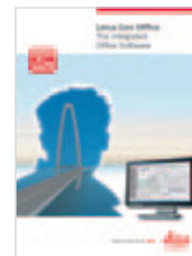
Leica Viva LGO Catálogo de producto