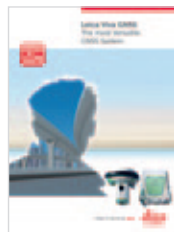
Leica Viva GNSS Catálogo de producto