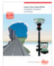
Leica Viva SmartPole Catálogo de producto