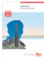
Leica Viva Catálogo general

Las Ilustraciones, descripciones y datos técnicos no son vinculantes y pueden ser modificados. Impreso en Suiza – Copyright Leica Geosystems AG, Heerbrugg, Suiza, 2009. 774103es – II.11 – RDV