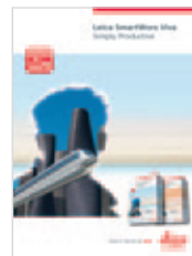
Leica SmartWorx Viva Catálogo de producto