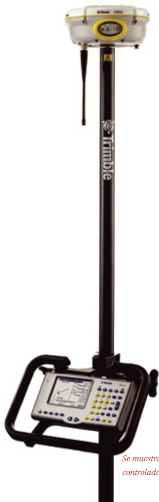
Se muestra con el controlador Trimble ACU

Preciso y confiable para obtener resultados seguros