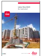
Leica Viva GS15